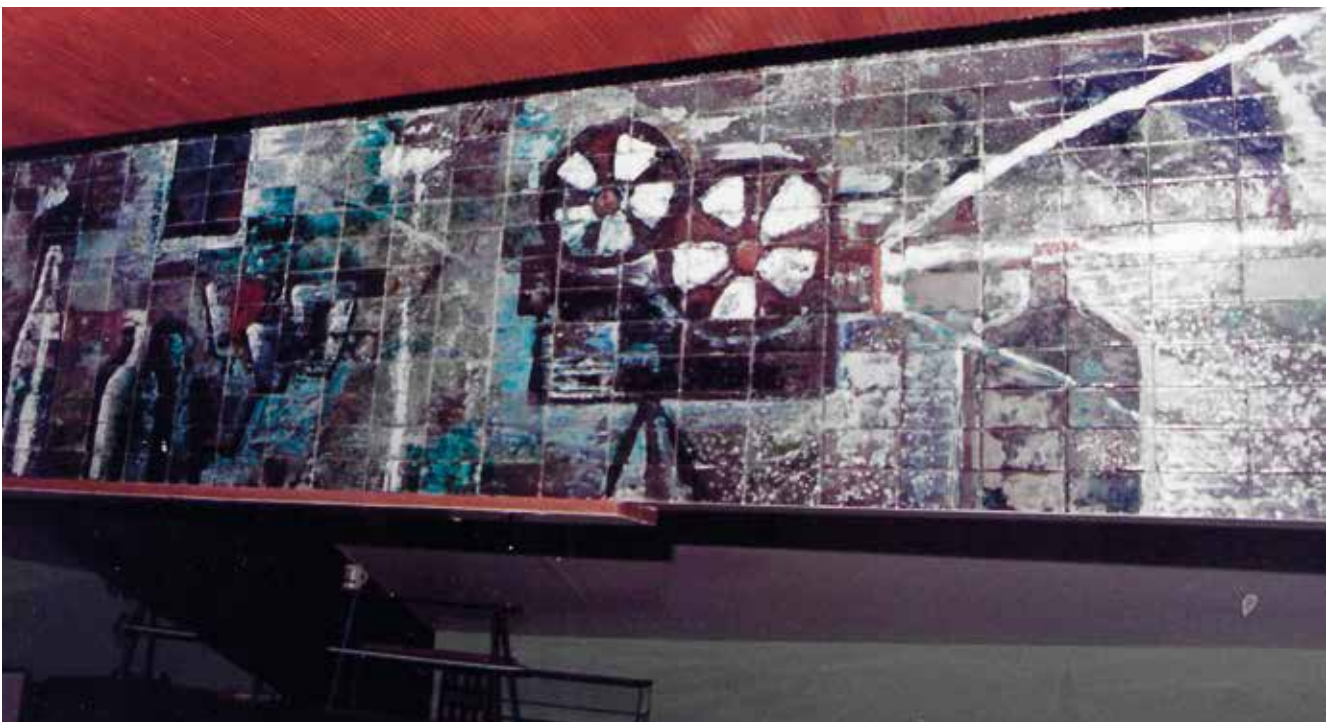
Cine Gaspar.

Cinematrográfiques.- En el "Cine Tossense", se projectaren els dos primers episodis de La muchacha de la emoción y Sangre y Arenas , adaptada de la famosa novel·la d'En Vicente Blasco Ibáñez, del mateix títol, la que agradá moltíssim. Programes com aqueixos s'ha haurien de fer sempre.