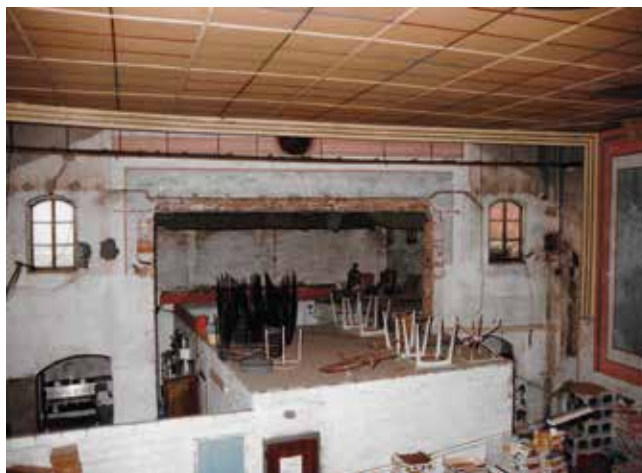
Cine Rovira.