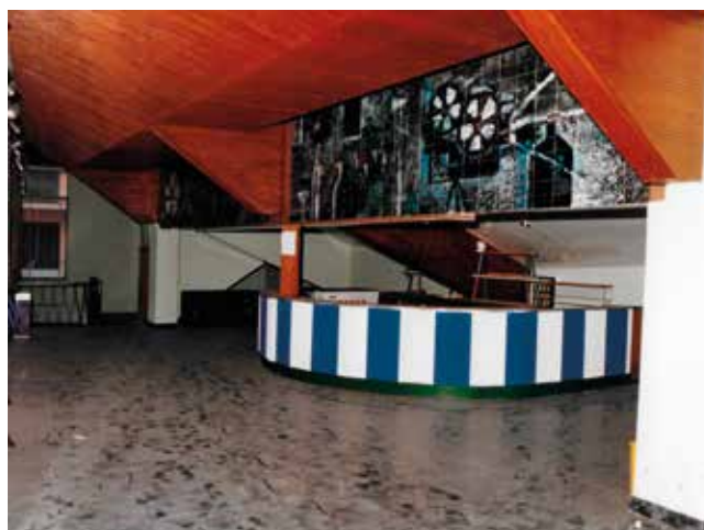
Cine Gaspar. Col·lecció família Margenats-Llobet

L'èxit aconseguit animà a construir un nou cine, el Gaspar, modern i confortable (800 localitats), que s'inaugurà el 21 de gener de 1962, després de tres anys d'obres a la carretera de Llagostera [avui avinguda de la Costa Brava]. Amb programació dobla gairebé diària, la seva requesta comportà el tancament del Rovira després de 27 anys de sessions ininterrompudes. [L'estructura d'aquest cinema ha desaparegut el 2024 amb la reforma de l'antic hotel Rovira, i l'obertura del nou establiment hotelier Elisabeth by the sea]. Dotat del necessari quant a qualitat de so i imatge, disposava d'un primer pis, una mena de balconada o gran llotja. Funcionà fins al 27 de setembre de 1992, i tancà per la manca d'una audiència suficient que el fes rendible. [Fou enderrocat el 1997, i en el seu lloc s'hi construí un edifici d'habitatges].