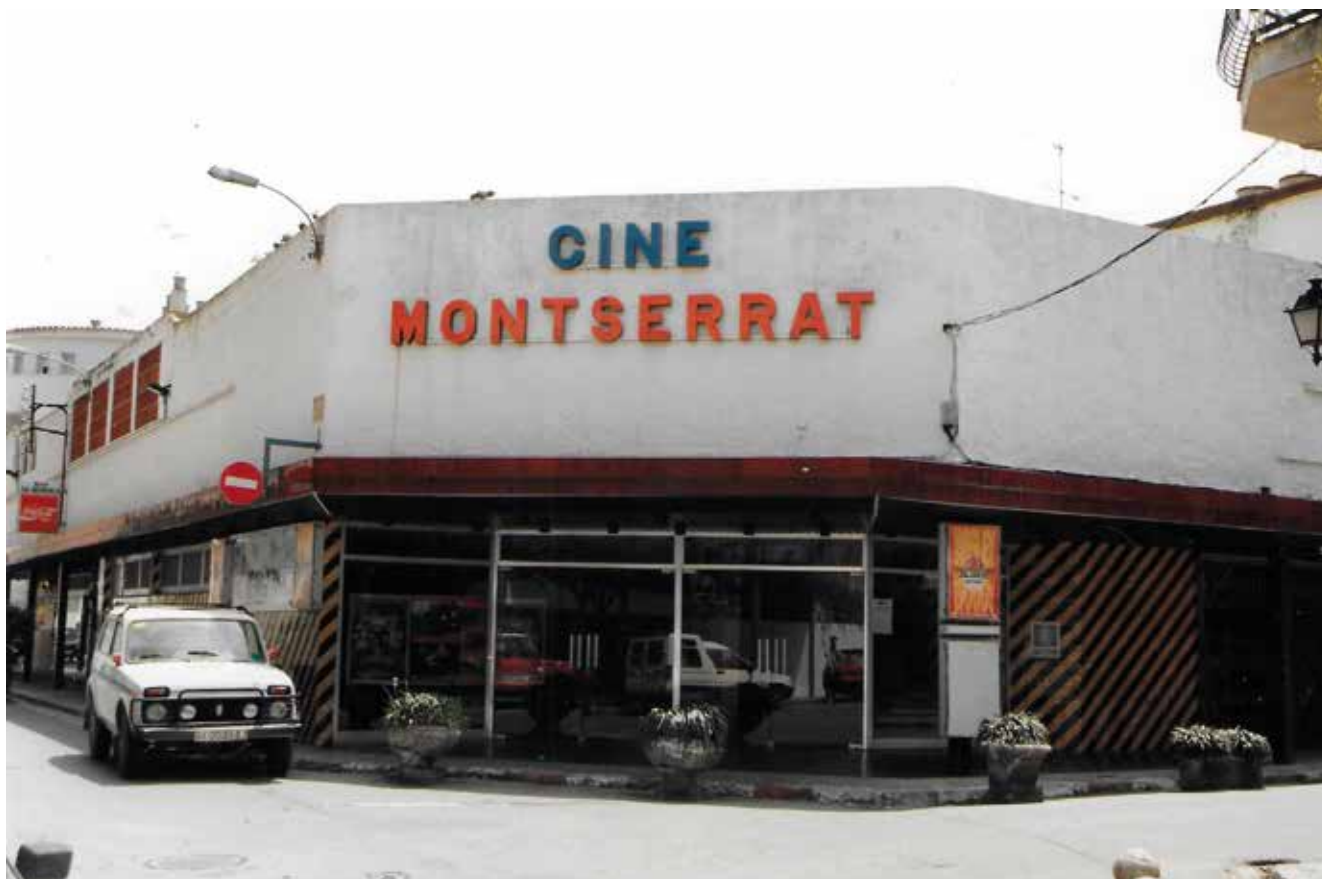
Cine Montserrat.

I el tercer cine de la família, el Montserrat (500 localitats), convisqué amb el Gaspar des del 6 de juliol de 1977, oferint una programació ben diferenciada que venia donada per la classificació censora dels films. Llavors, els aptes i infantils es passaven al Gaspar i els no aptes –per a majors de 18 anys– al Montserrat. Aquest s'erigí molt a prop de l'altre, en una part d'un garatge que ocupava una illa, propietat de la família. Les obres es començaren el 1976 i el cine s'equipà amb la tecnologia millor del moment.