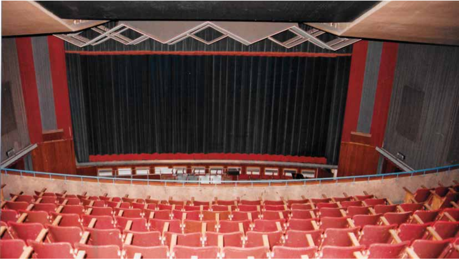
Cine Gaspar.