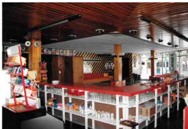
Cine Montserrat.