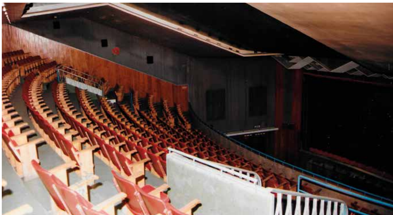
Cine Gaspar.

Ab programes aixís, augurém molts d'éxits.