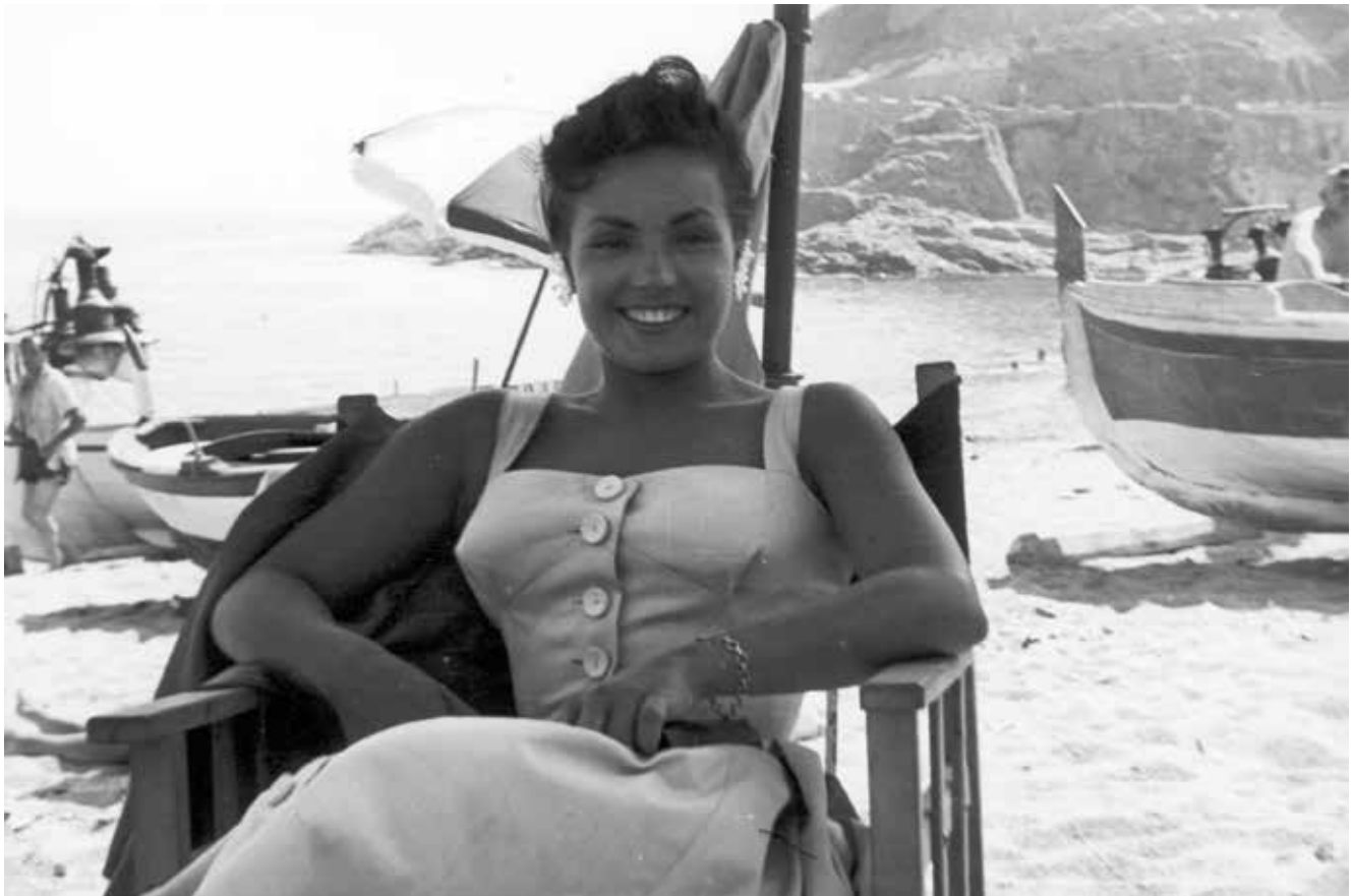
Col·lecció família Tort Ribas (AMT)