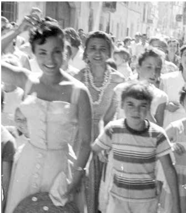
Col·lecció Napoleó Colomer Campi (AMT)