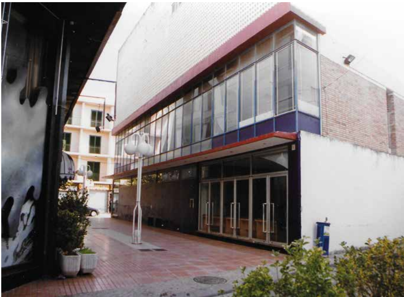
Cine Gaspar. Col·lecció família Margenats-Llobet

Parlem, per tant, dels tres dels Rovira-Samada. El primer, el Rovira, era una antiga sala de ball i cine a la qual es feren millores de tot ordre. Serví també per a representacions teatrals, concerts i pista de ball, canviant els seients de lloc. S'inaugurà el 1935 (400 localitats) i l'estiu de 1954 s'hi feren noves reformes, es compraren nous projectors (OSSA) i s'hi posà una pantalla panoràmica. Fins i tot s'amplià amb 200 localitats més, a l'altell.