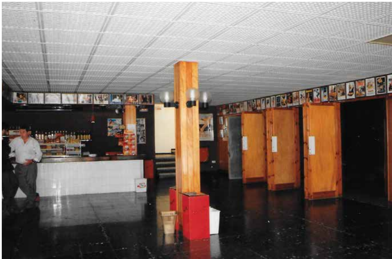
Cine Montserrat.

de la que'n formarà part l'aplaudit actor Jaume Borrás, contractada, segons diuen, per la casa Segre-Films, ab el fi d'impresionar una segona pel·lícula"; tot i que, en el número de l'11 d'abril, es publicava que malgrat l'anunciat, aquella companyia encara no havia vingut, i de fet, no hi hem sabut trobar cap altra referència. També el 18 de març de 1917 s'anunciava que Francisco Puigvert reporter de Actualidades Gaumont havia estat a Tossa per prendre fotos per una cinta. I, finalment, el 23 de setembre de 1917 llegim: "Fa uns dies tenim entre nosaltres una companyia de la casa Studio Film de Barcelona que està impressionant per diferents llocs y ab maestria una pel·lícula de llarch tiratge. Dirigeix la companyia D. Domingo Ceret".