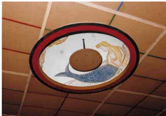
Cine Rovira.